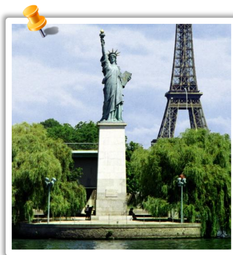
Copie à Paris (sur l'île aux Cygnes)