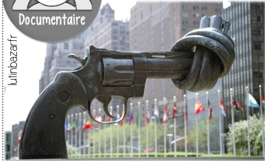
Sculpture « Non-Violence » de l'artiste Carl Fredrik Reuterswärd, au siège de l'ONU.

« La non-violence est la plus grande force que l'humanité ait à sa portée. Elle est plus puissante que l'arme la plus destructrice inventée par l'ingéniosité de l'homme. » – Gandhi