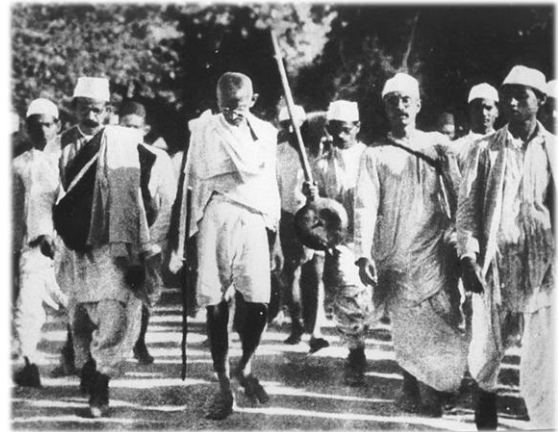
Gandhi pendant la marche du sel.

Gandhi est envoyé plusieurs fois en prison par les dirigeants britanniques de son pays.