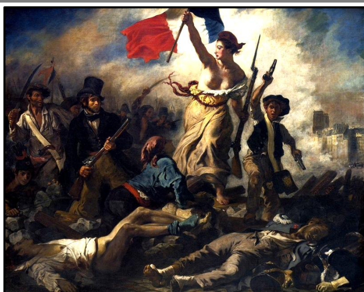
La liberté guidant le peuple d'E. Delacroix, 1830