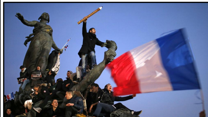
Le crayon guidant le peuple de S. Mahé, 11/01/2015