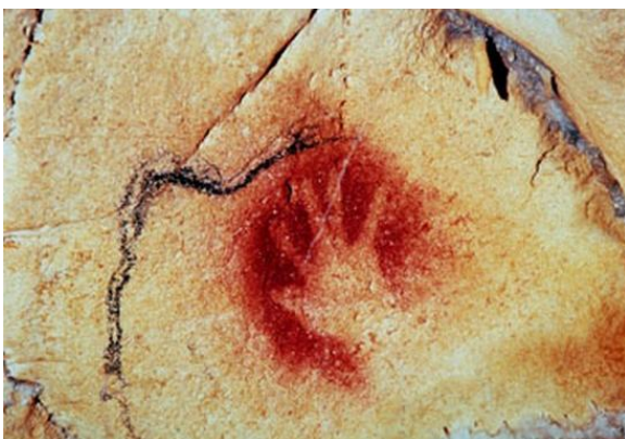
Empreinte de main négative, Grotte Chauvet (Ardèche)

Complicés à dessiner, ils sont souvent représentés dans les grottes du sud de la France.