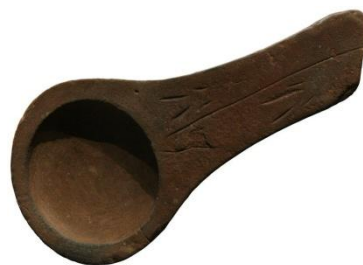
Lampe à graisse de renne en grès, trouvée dans la grotte de Lascaux