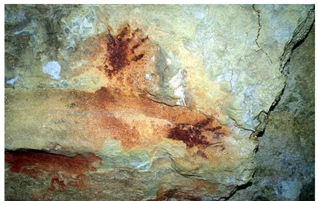
Empreintes de mains positives, Fuente Del Salin (Espagne)