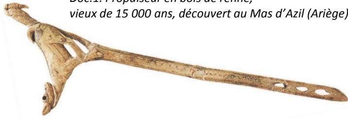
Doc.1. Propulseur en bois de renne, vieux de 15 000 ans, découvert au Mas d'Azil (Ariège)

Les archéologues ont étudié cet objet et ont cherché à quoi il pouvait servir. Ils pensent qu'il s'agit d'un propulseur qui permettait de lancer des flèches.