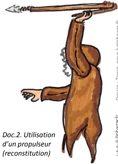
Doc.2. Utilisation d'un propulseur (reconstitution)

Cela nous apprend qu'ils chassaient pour se nourrir.