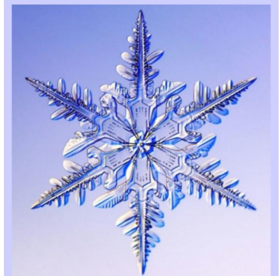
Le cristal de glace