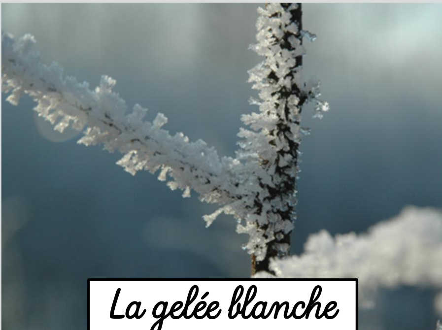
La gelée blanche