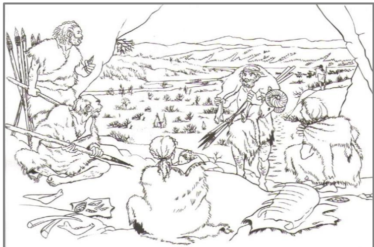
Doc.3. Scène de vie des hommes de Tautavel (reconstitution)

D'après cette reconstitution, l'homme de Tautavel connaissait-il le feu ?