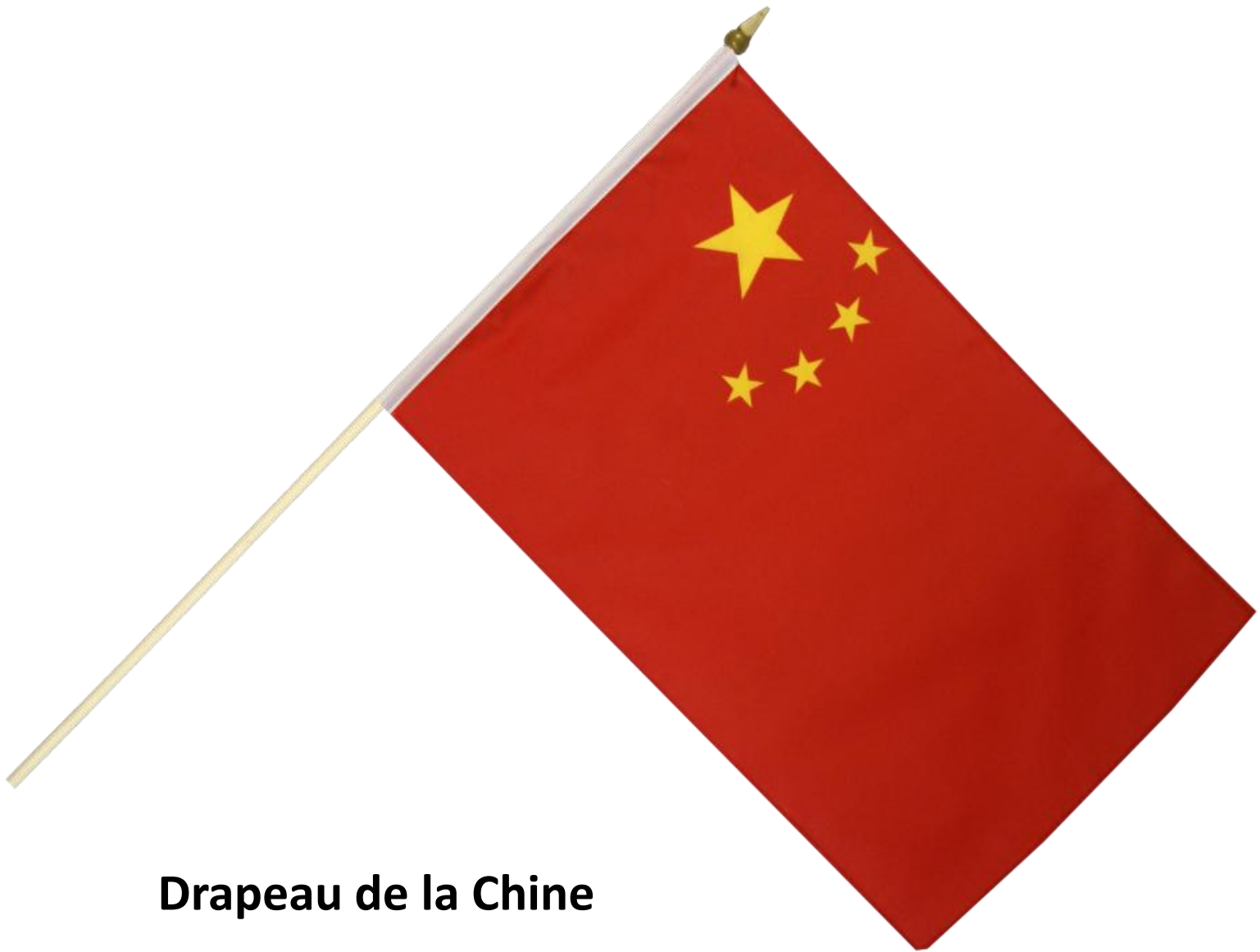
Drapeau de la Chine