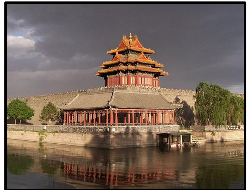
La tour d'angle nord-ouest et les douves