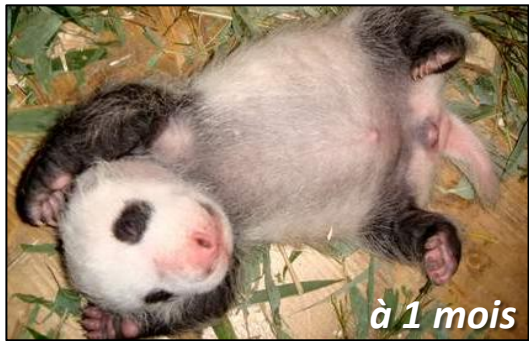
à 1 mois

A la naissance, le petit mesure la taille d'une souris (entre 11 et 17cm). Ses yeux sont fermés. Son corps est rose et couvert de quelques poils blancs. A une semaine, des taches noires apparaissent sur son corps.