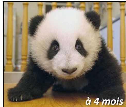
à 4 mois

Le petit quitte sa mère à l'âge d'un an et demi, lorsqu'il est assez costaud pour se défendre seul.