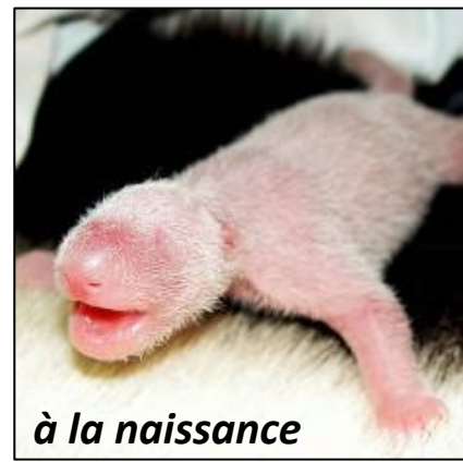
à la naissance

La femelle panda peut donner naissance à un ou deux petits, rarement trois. Comme prendre soin d'un seul petit est déjà difficile, la mère est souvent obligée de laisser les autres mourir.