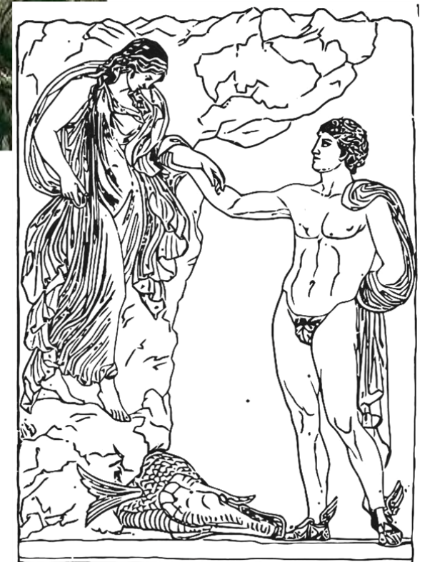
Persée et Andromède