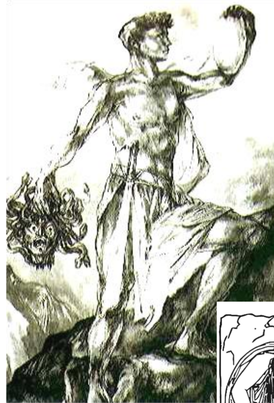
Persée tenant la tête de Méduse et le