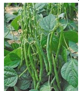
plant de haricot nain

*légume : partie comestible d'une plante potagère (racine, tige, feuille, fleur, fruit ou graine). Les champignons comestibles sont aussi des légumes.